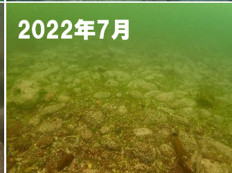
写真2 周辺海底の状況