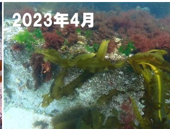
写真1 ケーソン上のコンブ

このケーソンの奥には、写真2のような海底が広がっており(以降、周辺海底)、これまでコンブの着生がみられていませんでした。